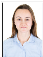
Photo qui sera sur votre carte Twisto Atoumod

Si vous souhaitez modifier votre photo, cliquez sur celle-ci et choisissez-en une nouvelle (1). Votre photo doit respecter le format passeport.